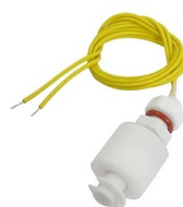
Magnetyczny czujnik poziomu wody CMW55 NC

Opis: Magnetyczny czujnik poziomu wody CMW40 podwójny, metalowy, kątowy; do +125°C. Wymiary sondy na foto w galerii. Długość 40cm; styk 2x NO.