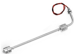
Czujnik poziomu cieczy; 2 pływaki; 40cm; kątowy

Opis: Magnetyczny czujnik poziomu wody CMW215; dwa pływaki. Montuje się je przeważnie w pokrywie zbiornika, do kontroli górnego i dolnego poziomu płynu. Styki 2x NC w stanie poczynku. Możliwość zamiany przez obrócenie pływaka.