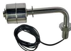
Czujnik poziomu ze stali nierdzewnej; CMW88

Opis: Magnetyczny czujnik poziomu wody CMW60 kątowy