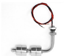
Magnetyczny czujnik poziomu; podwójny; kątowy