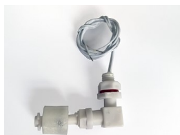
Magnetyczny czujnik poziomu wody; kątowy NO

Opis: Czujnik poziomu wody CMW55, magnetyczny, zestaw kontraktronowy