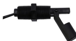
Magnetyczny czujnik poziomu wody CMWC105

Opis: Magnetyczny czujnik poziomu wody CMW90 rurka, Styk NC. Strefa zadziałania ok. 10mm.