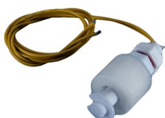
Magnetyczny czujnik poziomu wody CMW90 rurka, NC

Opis: Czujnik; kontaktronowy z magnezem; poziomu cieczy; CMW888; 100mA; 60V; AC; z przewodem 0,4mb. Czujnik poziomu ze stali nierdzewnej; NO; I max = 100mA. Magnetyczny czujnik poziomu wody